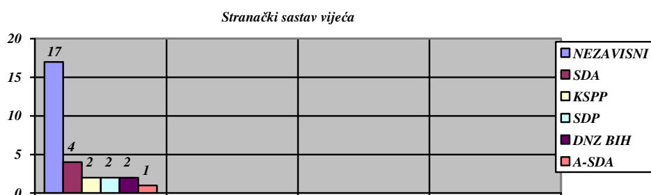
Tabela 1- Sastav Općinskog vijeća prema broju osvojenih vijećničkih mjesta

U aktuelnom sazivu Općinskog vijeća u skladu sa odredbama Poslovnika, kao oblik djelovanja vijećnika u Vijeću, u 2014.godini djelovalo je sedam klubova vijećnika, i to: