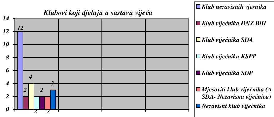
Tabela 2- Struktura Općinskog vijeća prema broju formiranih vijećničkih klubova

U toku 2014.godine došlo je do transformacija unutar formiranih klubova vijećnika, te do osnivanja novih klubova. Jedan vijećnik je izišao iz Kluba KSPP, te u Općinskom vijeću Općine Velika Kladuša dijeluje kao nezavisni vijećnik i na njega otpada 3,6 %.